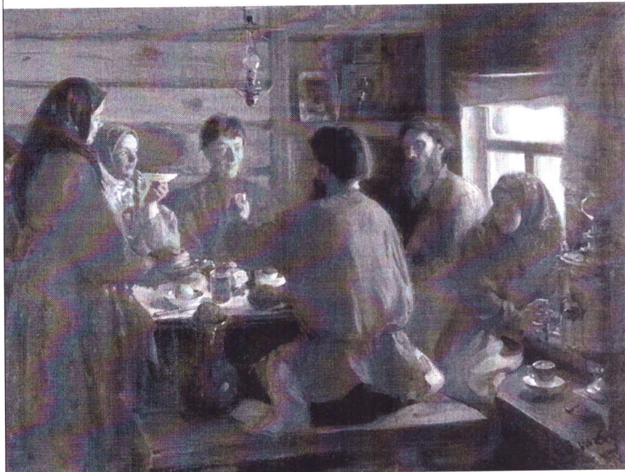
Куликов И.С. В крестьянской избе. 1902.

1. Какое отношение у героев произведений к своему жилищу? Что это подтверждает? Какой эмоциональный отклик на увиденное/прочитанное у вас возникает?